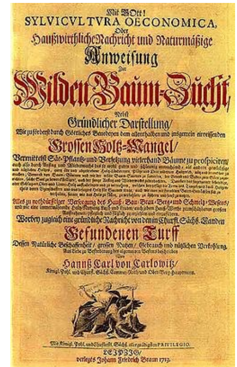
Titelblatt der Sylvicultura oeconomica, oder haußwirthliche Nachricht und Naturmäßige Anweisung zur wilden Baum-Zucht von 1713

1987 führte die Brundtland-Kommission der Vereinten Nationen den Ausdruck „Nachhaltige Entwicklung“ ein: „Entwicklung zukunftsfähig zu machen heißt, dass die gegenwärtige Generation ihre Bedürfnisse befriedigt, ohne die Fähigkeit der zukünftigen Generationen zu gefährden, ihre eigenen Bedürfnisse zu befriedigen.“